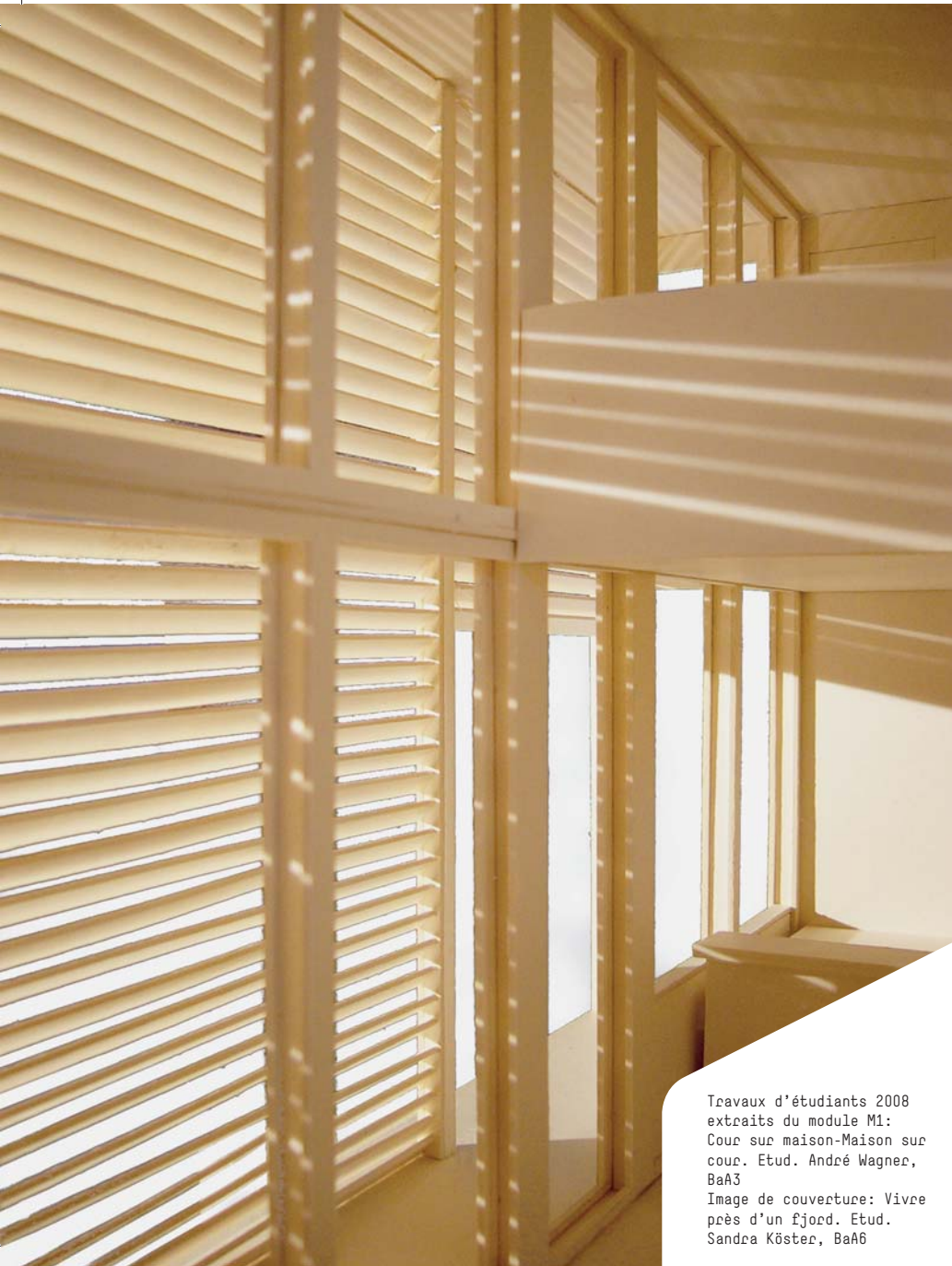
Travaux d'étudiants 2008 extraits du module M1: Cour sur maison-Maison sur cour. Etud. André Wagner, BaA3 Image de couverture: Vivre près d'un fjord. Etud. Sandra Köster, BaA6